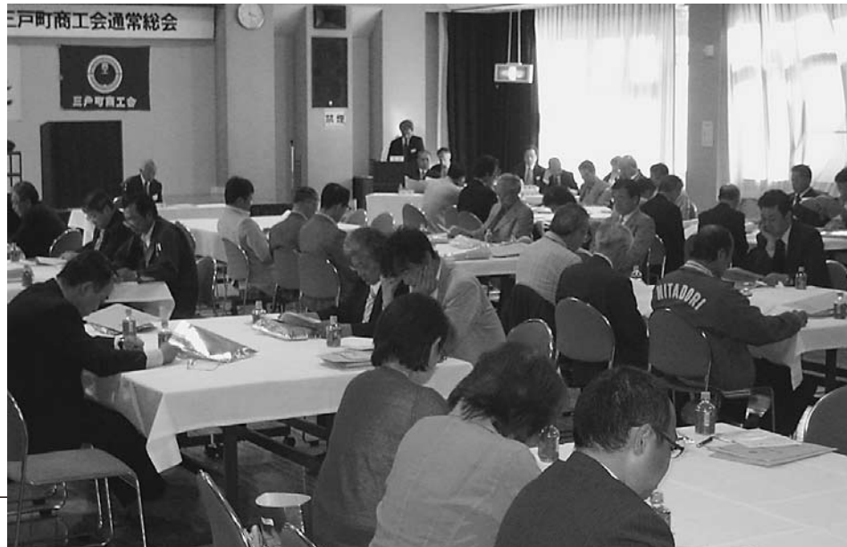
三戸町商工会通常総会